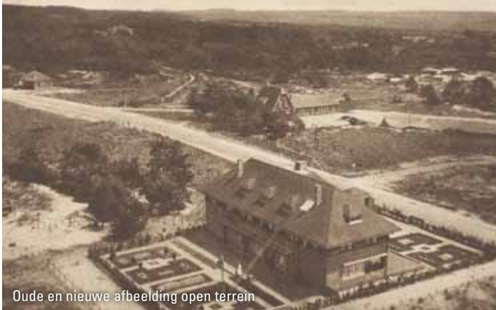
Oude en nieuwe afbeelding open terrein