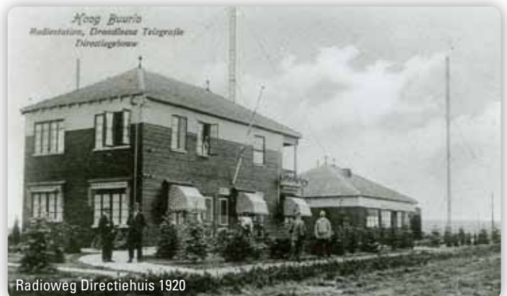
Radioweg Directiehuys 1920

In 1920 werd begonnen met een stenen directiegebouw met bovenwoning, ook wel het ingenieursgebouw of gebouw F genoemd, dat de keet in het barakkendorp moest vervangen. Een jaar later volgde het Tehuis voor Vrijgezelle ambtenaren, later Hotel Radio Kootwijk, in Amsterdamse School- en chaletstijl (hout gecombineerd met baksteen). Voor de korte golfzenders kwamen de gebouwen B, C, D en E tot stand,