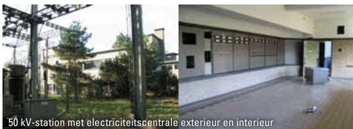
50 kV-station met electriciteitscentrale exterieur en interieur

Ook de werkplaats, gebouw G, met trafohuis stamt uit deze tijdperiode.