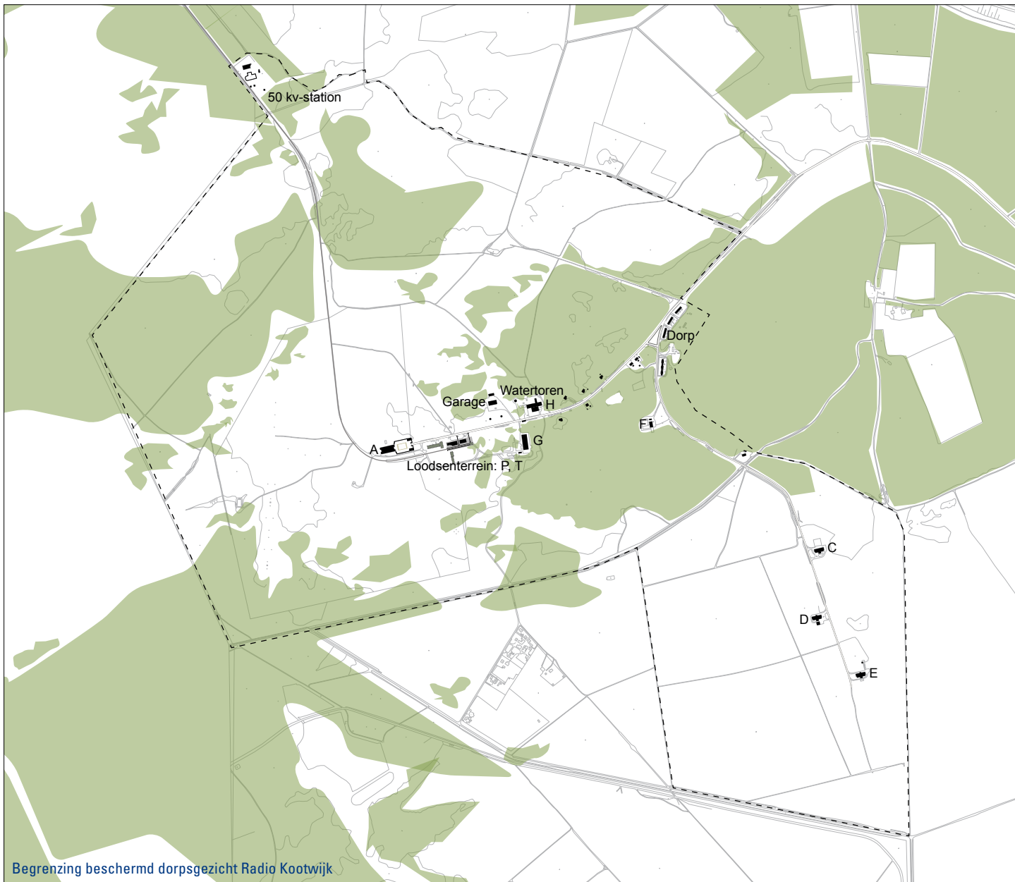
Begrenzing beschermd dorpsgezicht Radio Kootwijk