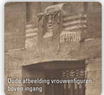
Oude afbeelding vrouwenfiguren boven ingang

samengewerkt met andere kunstenaars ter decoratie van de gebouwen. Boven de toegangsdeuren is een reliëf te zien, voorstellende een masker met geopende mond waarvan geluidsgolven uitgaan, geflankeerd door twee luisterende vrouwenfiguren, een Europese en een Oosterse, symboliserend de verbinding tussen Oost en West. Aan de achterzijde prijkt een groot rondboogvormig venster met erboven een adelaar. De adelaar symboliseert de vrijheid van de radiogolven in de lucht, de vlucht van het geluid. Beide reliëfs zijn een ontwerp van Hendrik van den Eijnde, beeldhouwer, meubelontwerper, graficus en tekenaar.