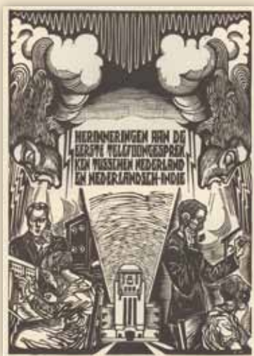
Afbeelding houtsnede uit "Hallo Bandoeng", hier Den Haag 1928

Apeldoorn kent naast monumenten en beeldbepalende panden ook beschermde stads- en dorpsgezichten en andere cultuurhistorisch waardevolle gebieden. Gaat het bij de objecten doorgaans om gaaf bewaarde architectuur uit het verleden, de stads- en dorpsgezichten richten zich meer op goed bewaarde voorbeelden van de ontwikkelingsgeschiedenis, die terug te zien is in wijken, kernen en nederzettingen. Radio Kootwijk is zo'n uniek voorbeeld, dat zelfs op nationaal niveau bescherming verdient.