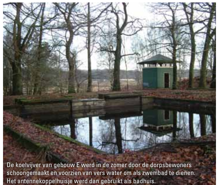
De koelvijver van gebouw E werd in de zomer door de dorpsbewoners schoongemaakt en voorzien van vers water om als zwembad te dienen. Het antennekoppelhuisje werd dan gebruikt als badhuis.

Voor de bouw van een radiostation is naast water voor de drinkwatervoorziening en koelviervers vooral elektriciteit van belang. Voor het oppompen en opslag van water verzezen twee pomphuisjes en een watertoren met daar bovenop een lichtbaken voor het luchtverkeer. Dit baken is nu niet meer in gebruik. Halverwege het spoorlijntje werd voor de elektriciteit een 50kV-station gebouwd.