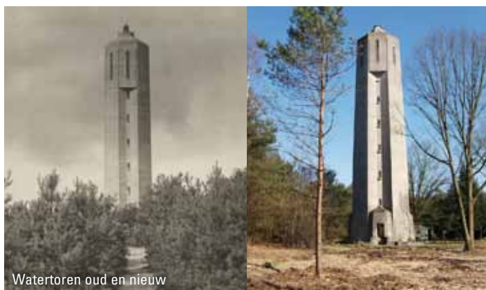
Watertoren oud en nieuw

Radio Kootwijk is een plek van verbinden, beleven van cultuur en natuur, van heden, verleden en toekomst. Het is een intrigerende omgeving die tot nieuwe ideeën inspireert. Gebouwen, stuifduinen en hei versterken elkaar. Het is ruimte die je raakt. Die combinatie maakt Radio Kootwijk tot een bijzondere plek; een plek die bewaard blijft voor generaties na ons op een manier die ook economisch verantwoord is. Daarmee is de herontwikkeling een invulling van de modernisering van de monumentenzorg: niet restaureren voor leegstand, maar voor economisch en cultuurhistorisch verantwoord hergebruik. De plannen worden door Staatsbosbeheer ingevuld in nauwe samenwerking met de gemeente Apeldoorn, de provincie Gelderland en de Rijksdienst voor het Cultureel Erfgoed. Die samenwerking heeft onder meer geresulteerd in een gezamenlijk financieel draagvlak en ook in het gezamenlijk opstellen van een nieuw, en inmiddels vastgesteld bestemmings- en beeldkwaliteitsplan. In deze plannen zijn de cultuurhistorische, architectonische en natuurwaarden niet alleen individueel maar ook in hun onderlinge samenhang beschouwd.