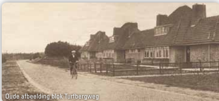
Oude afbeelding blok Turfbergweg

De garage aan de voet van de watertoren is tijdens de Tweede Wereldoorlog in opdracht van de Duitse bezetter gebouwd. Het gebouw diende voor de stalling en onderhoud van motorvoertuigen.